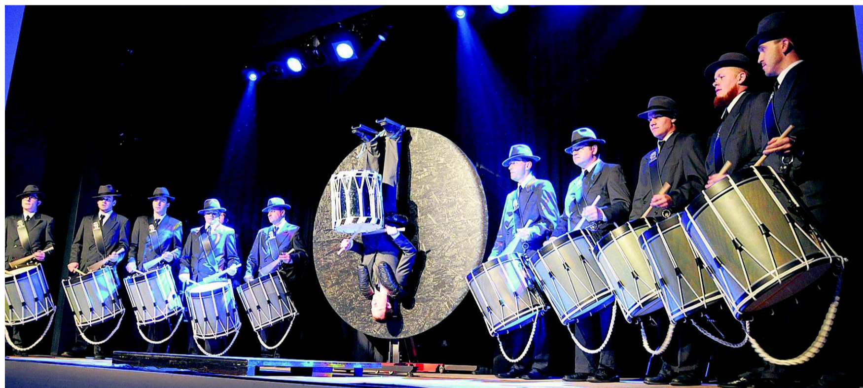
Erlinsbach steht Kopf: Der Tambourenverein begeisterte bei der vierten eigenen Trommelshow «Drumbazamba» sein Publikum.

Die Clara-Schwestern suchen freiwillige Helfer für den Umbau. Günstig abzugeben ist noch Pflege-Infrastruktur. Mehr unter: clara-schwestern@bluewin.ch oder Telefon: 062 844 45 50.