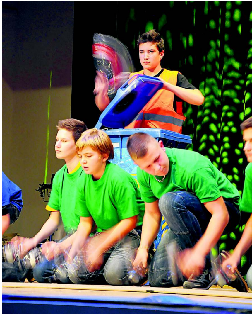
Die Jungtambouren im Einsatz mit PET-Flaschen und PET-Containern.

Mehr Bilder zum «Drumbazamba» finden Sie online unter aargauerzeitung.ch